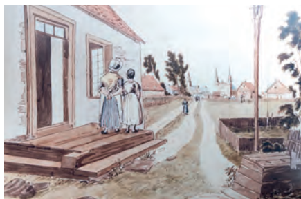
Illustration : Charlesbourg 1830 James Pattison Cockburn

Pour découvrir plus de trois siècles d'histoire de notre paroisse, visitez notre exposition permanente ou faites une visite virtuelle 360° de l'église Saint-Charles-Borromée ( www.pscb.ca ).